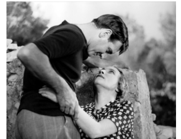
1936 CÉSAR de Marcel Pagnol avec Orane Demazis