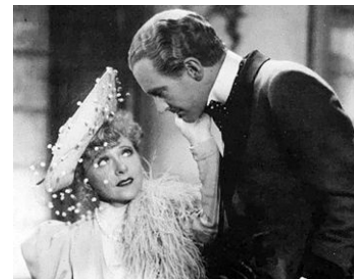
1938 TROIS VALSES de Ludwig Berger avec Yvonne Printemps