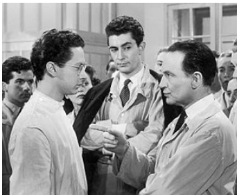
1951 UN GRAND PATRON d'Henri Decoin avec Claude Nicot, Jean-Claude Pascal