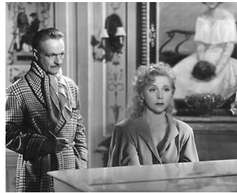
1947 LES CONDAMNÉS de Georges Lacombe avec Yvonne Printemps