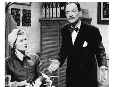
1956 LES ŒUFS DE L'AUTRUCHE de Denys de La Patellière avec Simone Renant