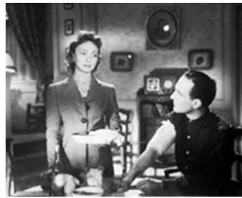
1943 L'ESCALIER SANS FIN de Georges Lacombe avec Madeleine Renaud