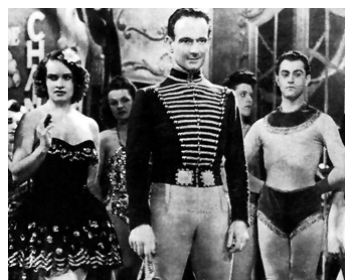
1941 LE BRISEUR DE CHAÎNES de Jacques Daniel-Norman avec Ginette Leclerc