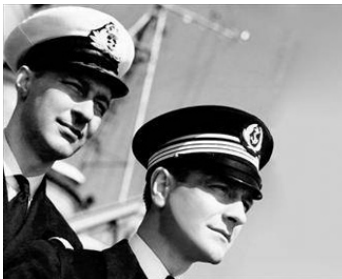
1937 ALERTE EN MÉDITERRANÉE de Léo Joannon avec Rolf Wäncka