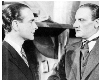
1935 LE ROMAN D'UN JEUNE HOMME PAUVRE d'Abel Gance avec Saturnin Fabre