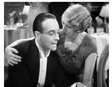
1934 L'HOMME QUI EN SAVAIT TROP (The Man who knew too much) d'A. Hitchcock avec Edna Best