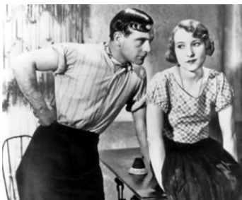
1931 MARIUS d'Alexander Korda & M. Pagnol avec Orane Demazis