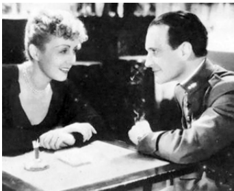
1936 SALONIQUE, NID D'ESPIONS de Georg Wilhelm Pabst avec Dita Parlo