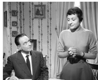
1956 L'HOMME AUX CLÉS D'OR de Léo Joannon avec Annie Girardot