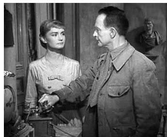
1955 LES ARISTOCRATES de Denys de La Patellière avec Brigitte Aubert