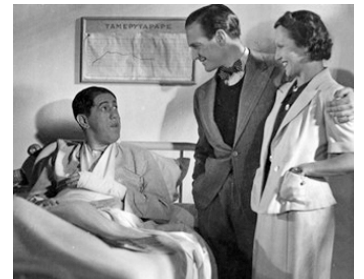
1937 LA BATAILLE SILENCIEUSE de Pierre Billon avec Michel Simon, Käthe de Nagy