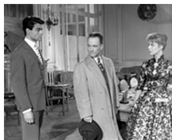
1958 TANT D'AMOUR PERDU de Léo Joannon avec Claude Titre, Anne Doat