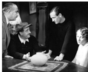
1932 FANNY de Marc Allégret avec Fernand Charpin, Raimu, Orane Demazis