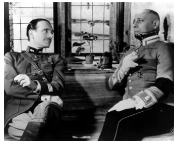
1937 LA GRANDE ILLUSION de Jean Renoir avec Erich von Stroheim