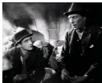
1939 LA CHARRETTE FANTÔME de Julien Duvivier avec Louis Jouvet