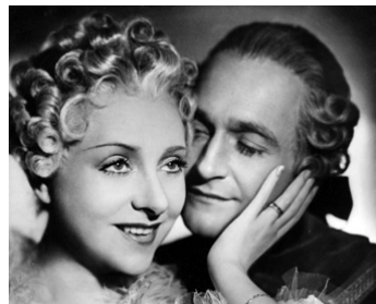
1938 ADRIENNE LECOUVREUR de Marcel L'Herbier avec Yvonne Printemps