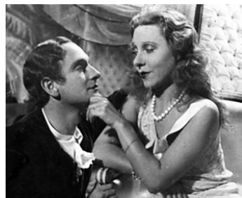
1934 LA DAME AUX CAMÉLIAS de Fernand Rivers avec Yvonne Printemps