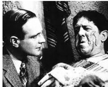
1935 SOUS LES YEUX D'OCCIDENT de Marc Allégret avec Michel Simon