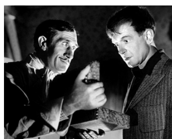
1943 LA MAIN DU DIABLE de Maurice Tourneur avec Noël Roquevert