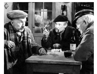
1960 LES VIEUX DE LA VIEILLE de Gilles Grangier avec Noël-Noël, Jean Gabin