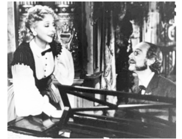
1949 LA VALSE DE PARIS de Marcel Achard avec Yvonne Printemps