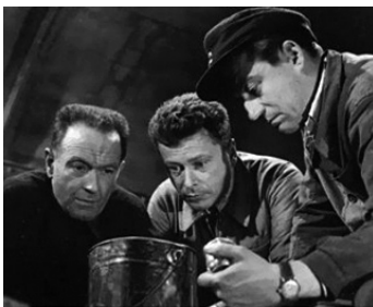
1954 LES ÉVADÉS de Jean-Paul Le Chanois avec Michel André, François Périer