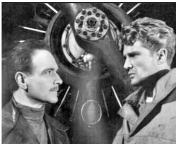
1949 AU GRAND BALCON d'Henri Decoin avec Georges Marchal