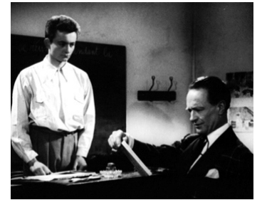
1953 LA ROUTE NAPOLÉON de Jean Delannoy avec Claude Laydu