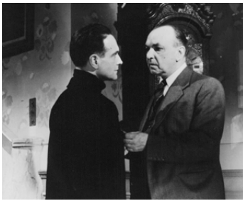
1943 LE VOYAGEUR SANS BAGAGES de Jean Anouilh avec Pierre Renoir