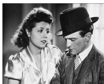
1942 L'ASSASSIN HABITE AU 21 d'Henri-Georges Clouzot avec Suzy Delair