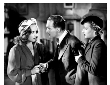
1943 LE CORBEAU d'Henri-Georges Clouzot avec Ginette Leclerc, Micheline Francey