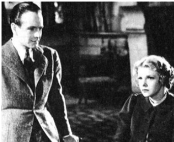
1935 KOENIGSMARK de Maurice Tourneur avec Elissa Landi