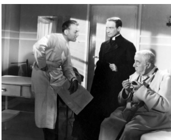
1939 LE DUEL de Pierre Fresnay avec Raymond Rouleau, Raimu