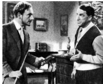
1949 VIENT DE PARAÎTRE de Jacques Houssin avec Rellys